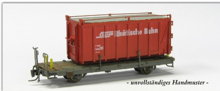
- unvollständiges Handmuster -