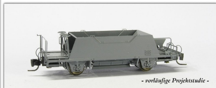
- vorläufige Projektstudie -

Fast baugleiche Wagen fahren bzw. fuhr auf der FO/MGB, SBB-Brünig/ZB, MOB und GFM/tpf.