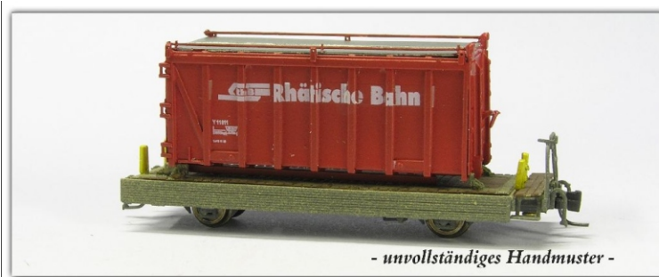
- unvollständiges Handmuster -

Die Vorbereitungen sind soweit fortgeschritten, dass wir die Auslieferung von Fahrzeug und Container nun für 2013 planen.