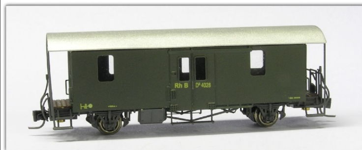
Nm-105.5: RhB - Gepäckwagen, grün, ursprüngliches Logo, Betriebsnummern D 2 4028 oder D 2 4041