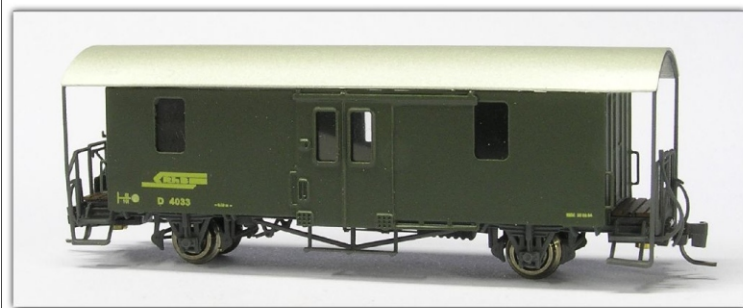
Nm-105.4: RhB - Gepäckwagen, grün, modernes Logo, Betriebsnummern D 2 4033 oder D 2 4042

Bilder und weitere Informationen erhalten Sie im Laufe des Jahres 2013.