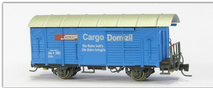
Nm-014.3: RhB gedeckter Güterwagen, blau, Cargo Domicil, Gbk-v 5501 ff.

Gbk-v 5504 Gbk-v 5513 Gbk-v 5517 Gbk-v 5510 Gbk-v 5515 Gbk-v 5526