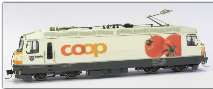
Nm-206.1: RhB Ge4/4 m 641 Coop mit Tomatenmotiv Stamnetz-Universallokomotive

So entstanden im Laufe der letzten Jahre mehrere Varianten einer weißen Lok mit dunkelgrauer Schürze, silberner Zierlinie und plakativer Coop-Beschriftung.