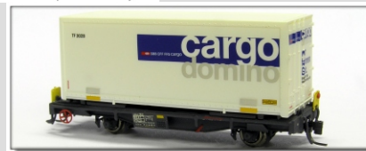
Nm-013.4: RhB Tragwagen Lb-v 7861 ff., SBB Wechselbrücke Koffer "cargo domino" (Fleischmann)

Tragwagen mit Wechselkoffer der SBB "cargo domino" Einsatz ab 1999 Konstruktion Lok-Schlosserei Kunststoffbehälter Fleischmann limitierte Sonderserie Vorbestellungen bis 15.09.2010 Vorbestellpreis: € 115,- Normalpreis: € 125,-