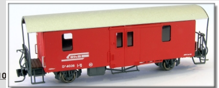
Nm-105.1: RhB Gepäckwagen mit Stahlaufbau D² 4038

Gepäckwagen der RhB in modernisierter Form, mit glattem Stahlkasten und abgerundeten Fenstern Farbe: rot Einsatz bis 1984 Konstruktion N-Track Vorbestellungen bis 15.04.2010 Vorbestellpreis: € 129,- Normalpreis: € 139,-