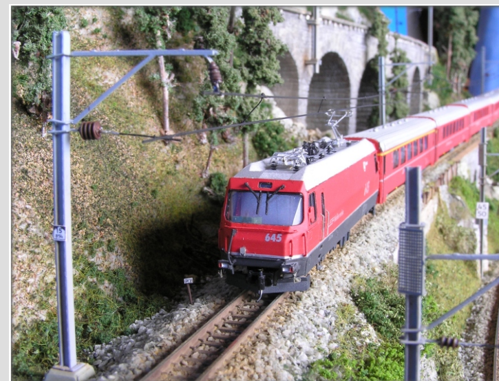
Ausschnitt aus unserem Diorama - "Die RhB unter Fahrleitung"

Auch 2010 wird ein guter Jahrgang für die Liebhaber feiner N-Schmalspur-Modelle.