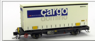
Nm-013.3: RhB Tragwagen Lb-v 7861 ff., SBB Wechselbrücke Plane "cargo domino" (Fleischmann)

Güterwagen aus der Erstaustattung der RhB, mit neuem Stahlaufbau und silbernen Türen 2 Betriebsnummern erhältlich Einsatz ab Mitte 1970er Konstruktion N-Track Vorbestellungen bis 15.04.2010 Vorbestellpreis: € 129,- Normalpreis: € 139,-