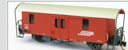
Nm-105.2: RhB Dienstwagen Xk 9021 Materialwagen

Dienstwagen Xk 9021 der RhB, auf Basis eines Gepäckwagens Farbe: oxyd-orange Einsatz 1982 bis 2004 Konstruktion N-Track Vorbestellungen bis 15.04.2010 Vorbestellpreis: € 129,- Normalpreis: € 139,-