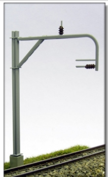
Nm-701.1: RhB Streckenmast mit geradem Ausleger ohne Speiseleitung

Alle Details dazu in Kürze auf unserer Internet-Seite www.n-schmalspur.de