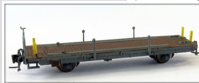
Nm-016.2: RhB Tragwagen für Abrollcontainer Kp-w 7501 ff.

Tragwagen für Abrollcontainer in modernisierter Form 2 Betriebsnummern geplant Abrollcontainer geplant Einsatz ab ca. 1990 Konstruktion NES Das Modell befindet sich noch in der Projektphase. Lieferbarkeit und Preis nach Erscheinen.