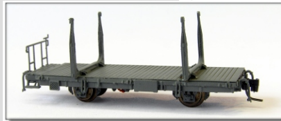
Nm-012.2: RhB Rungenwagen mit Zurösen Kk 7351 ff.

Zweiachsiger Rungenwagen mit Zurösen für Holztransporte 3 Betriebsnummern lieferbar Echtholzladung lieferbar Einsatz ab 1989 Konstruktion NES Vorbestellungen bis 15.06.2010 Vorbestellpreis: € 109,- Normalpreis: € 119,-