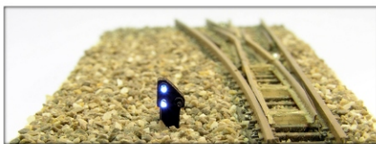
Zub-8505: Zwergsignal zur Anzeige der Weichenstellung MicroScale-Modell

Dreiflammiges Zwergsignal zur Anzeige der Weichenstellung, jede Leuchtdiode separat ansteuerbar. Hersteller MicroScale Preis: € 45,-