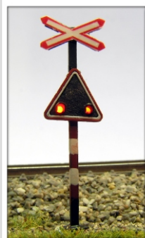
Zub-8511: Warnblinkler Bahnübergang Paar mit Blinkelektronik MicroScale-Modell

Alle Signale sind komplett verdrahtet und mittels beigefügter Anleitung problemlos anzuschließen.