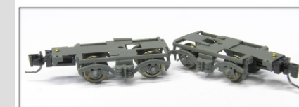
Nm-199.2: Drehgestellpaar für Personenwagen des Typs EW IV, komplett mit Radsätzen und Kupplung

Wir bieten die Leichtlaufdrehgestelle als fertig montiertes und lackiertes Ersatzteil an. Sie setzen nur die Radsätze ein und schrauben bei Bedarf die Kupplung wieder an ihren Platz. Außerdem wird es die Drehgestelle als Fertigmodell mit eingesetzten Radsätzen bzw. Kupplung geben. Leichter geht es kaum.