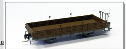
Nm-015.1: RhB Niederbordwagen mit Holzwänden Kk 7301 ff.

Ursprungsausführung des Niederbordwagens M1 mit Holzborden, als Kk beschriftet Einsatz bis Mitte 1970er 3 Betriebsnummern geplant Konstruktion NES Vorbestellungen bis 15.06.2010 Vorbestellpreis: € 99,- Normalpreis: € 109,-