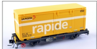
Nm-013.2: RhB Tragwagen Lb-v 7861 ff. beladen mit Wechselbehälter PTT (Creanorm)

Die Behälter werden magnetisch auf dem Fahrzeug gehalten. Die Beladung ist problemlos abnehmbar. Einsatz ab 1999 5 Betriebsnummern lieferbar diverse Wechselbehälter-Nummern in Kunststoff und Messing lieferbar