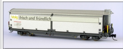
Nm-008.2: RhB Schiebewandwagen mit Kühlaggregat Hai-yy 5175 - 5176 "Volg"

Schiebewandwagen mit Kühlaggregat als zeitloses schlichte Werbevariante der Firma "Volg" 2 Betriebsnummern Sonderserie AB-Modell Vorbestellungen bis 15.03.2010 Vorbestellpreis: € 157,- Normalpreis: € 163,- Das Fahrzeug wird bereits mit den neuen Leichtlaufdrehgestellen ausgerüstet.