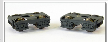
Nm-099.2: Leichtlaufdrehgestell für 4-achsige Güterwagen, 2 Stück, Fertigmodell, mit Radsätzen

Lieferbarkeit und Preis sind zur Zeit noch nicht bekannt.