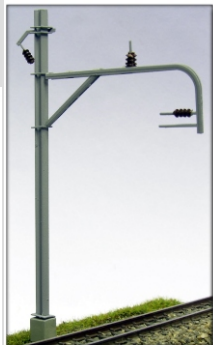
Nm-702.2: RhB Streckenmast mit gebogenem Ausleger und einpoliger Speiseleitung