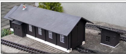
0m-401.1: Lokschuppen mit Ausbau und Wärterbude Bausatz für AlpinLine-Gleis, Spur 0m - 1:45

Der Bausatz besteht aus passgenau zugeschnittenen Kunststoffplatten. Die Bretterfugen sind angezeichnet und werden mit einem spitzen Stift eingeritzt. Die Wände werden zusammengesteckt, die weiteren Bauteile geklebt. Der hohe Spielwert wird durch die zu öffnenden Tore und das abnehmbare Dach unterstrichen. Das fertige Modell behandeln Sie farblich nach Ihren eigenen Vorstellungen. Das Modell ist wetterfest, sollte im Winter jedoch trocken gelagert werden.