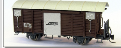
Nm-014.2: RhB gedeckter Güterwagen, silberne Türen/Schieber, Gbk-v 5501 ff.

Güterwagen aus der Erstaustattung der RhB, mit neuem Stahlaufbau und silbernen Türen 2 Betriebsnummern erhältlich Einsatz ab Mitte 1970er Konstruktion N-Track Vorbestellungen bis 15.04.2010 Vorbestellpreis: € 129,- Normalpreis: € 139,-