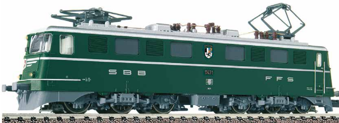
Handmuster mit vorläufiger Beschriftung