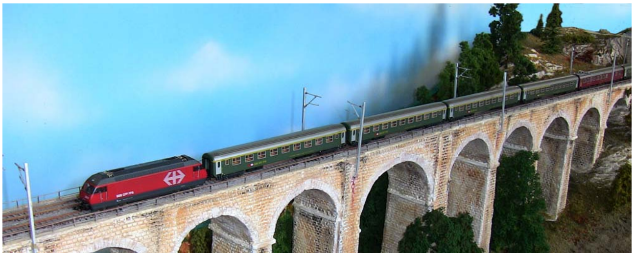
d'Brugg vo Boudry

D'sNs-Modulgruppe trifft sich abwächsliswis a geeignete Ort, zum ihri Modul zu grosse Alage zämme z'setze und gehörig Betrieb z'mache. Die private oder öffentliche Träffe findet eis bis drü Mal im Johr im In- und Usland statt. Mol eher chlii und fii, mol im grosse internationale Rahme - bishpielswies 2007 z'Stuttgart, wo Modul vo 563m Gsamtlängi (im Original sind das über 200 Streckekilometer) vo vierzäh Gruppierige us sächs Länder zu n'ere Wältrekord-Alag zämmegsetzt worde sind.