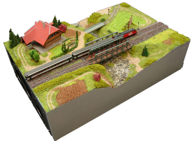
es sNs-Strecke-Modul 60x40cm

Üseri Modulnorm lehnet sich eng a anderi Norme a, so chönd üseri Modul relativ liecht mit Modul vo andere Gruppierige vebunde werde.