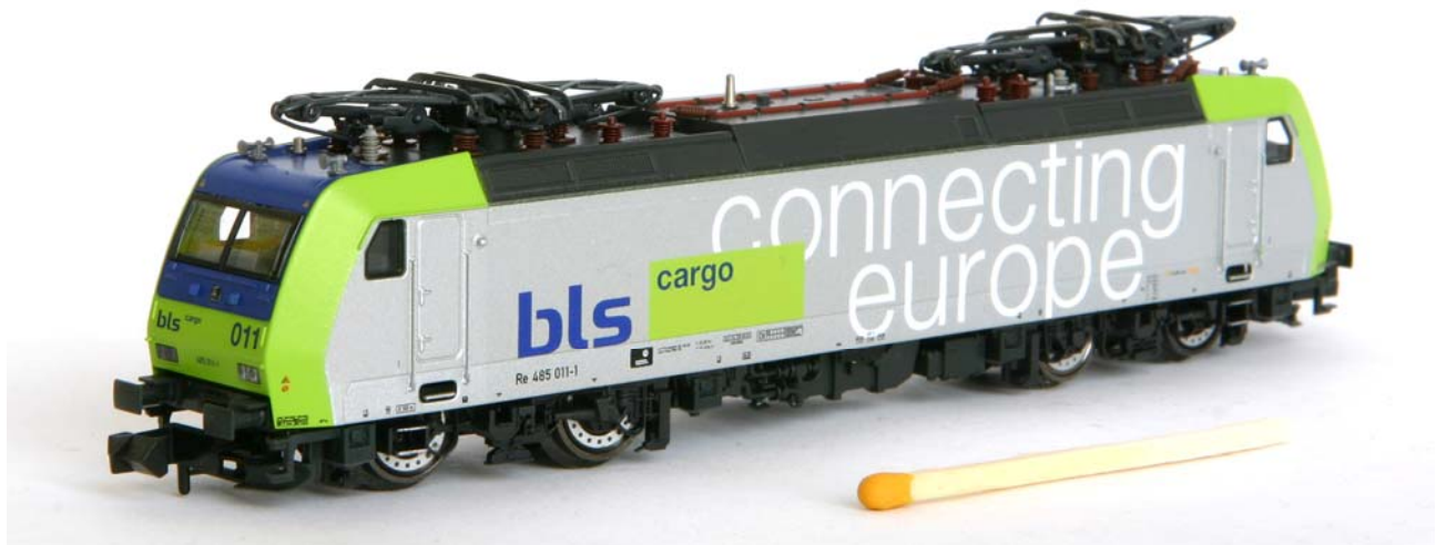
Grössevergleich zwüsche d'eneré moderne BLS Re 485 und em'ene Zündhölzli