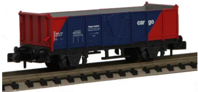
sNs-Projekt: Laggierig und Bedruckig vo m'ene Güeterwage

I de Schpur N wird s'Vorbild 160 mol verchlineret noch ebildet. Im Vergleich zu grössere Modellbahne schpart das äntwäder Platz oder s'ermöglicht langi Züg, grossi Radie und eine grosszügige Gländegschaltig. De gröscht Vorteil vo de Schpur N: im technische Sinn sind all Härsteller vo rollendem Material unterenand kompatibel. Denn d'Kupplig, d'Spannig wie au d'Radsätz- und d'Gleissmass sind glich. Zu dem verfüeged die hütige Modäll über hervorragendi Laufeigenschafté.